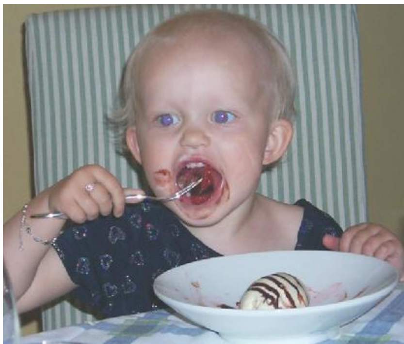
Tora firar med glass & jordgubbar

Sen fick jag vända mig om för nu skulle man ta samma prov i en knäskål. Samma helvetiska smärta, samma krampaktiga tag om stolskanterna.